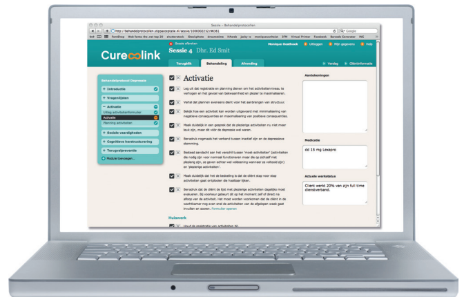
Impressie van een sessie